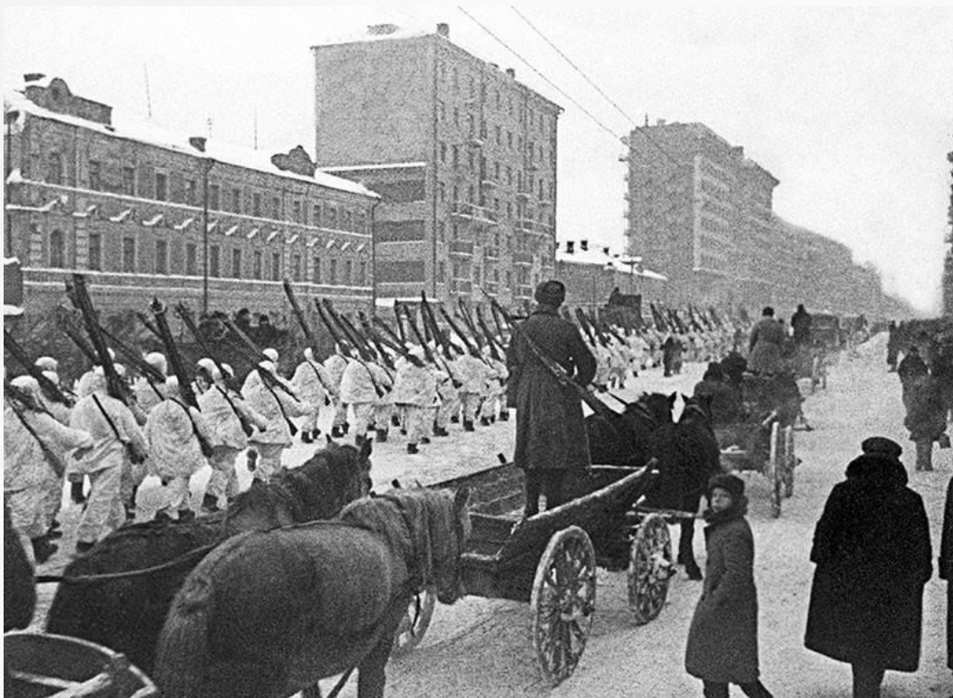
Парад 7 ноября 1941 год